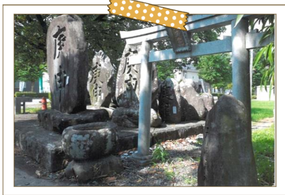
地区の守り神 道祖神と天満宮

市役所周辺でナイスロード沿いに広がる地域です。多様な商業施設があり、とても便利で住みやすい地域です。