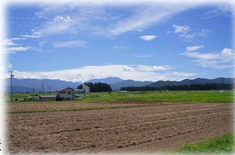
仙美常会周辺の田園風景