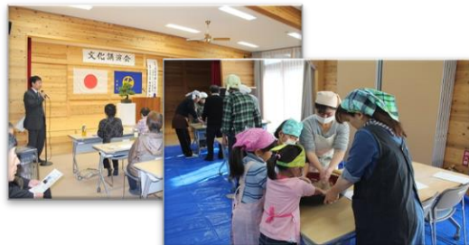
自分で打ったそばは特に美味しいと評判

ごみの出し方については、各常会の衛生部長さん、または組長さんにお問い合わせください。