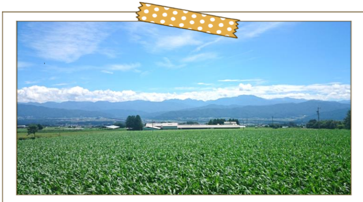
ますみヶ丘区公民館から見た南アルプス

地域の教科書は、地域の様子や行事、必要となる負担など、地域で暮らし始めるために知っておきたい情報を事前にお知らせすることを目的に作成しました。