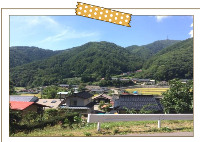
地区西側から望む

地域の教科書は、地域の様子や行事、必要となる負担など、地域で暮らし始めるために知っておきたい情報を事前にお知らせすることを目的に作成しました。 縁あって同じ地域に住むことになった皆さまが、地域の住民として存心して暮らしが始められ、スムーズにコミュニティになじみ、ともにより地域を作っていく仲間になってほしい。そんな願いを込めて作成しています。