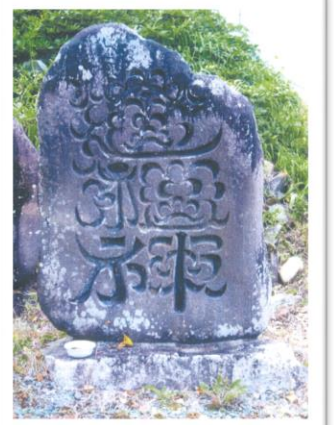
塩供にある花文字の道祖神

私たちの集落には外から来られた方も何人もいますが、隣近所や行事、作業などでコミュニケーションを深めて仲良くやっています。わからないことがあったら、組長さんや総代、ご近所に遠慮しないで聞いてください。