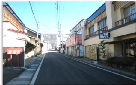
町 内 風 景

何 か わ か ら な い こ と が あ り ま し た ら 、総 務 会 計 ま た は町 内 会 長 に お 問 い 合 わ せ く だ さ い。