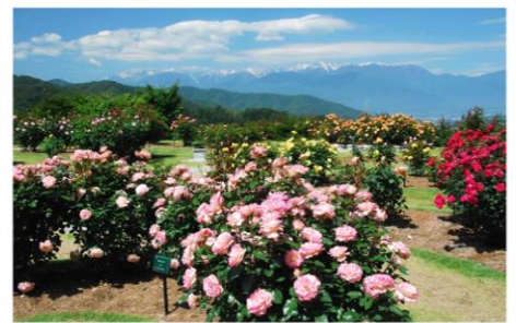
中央アルプスに映えるバラ