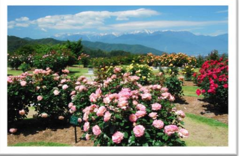
中央アルプスに映えるバラ