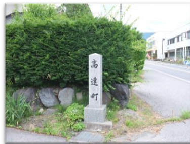
旧高遠町と旧伊那市との境