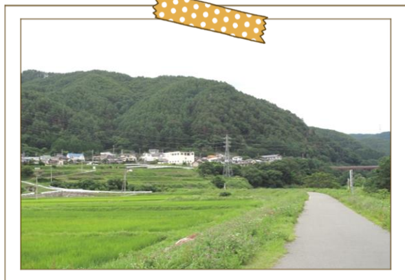
三峰川から見た夏の千年町

合併前の伊那市との境にあり、約35年前からできた地区で10世帯から年々増加し、現在は42世帯になりました。比較的若い町内です。景観がすばらしく、南アルプスと中央アルプスが一望でき、春には高遠城址公園の桜も見る事ができる最高の場所です。