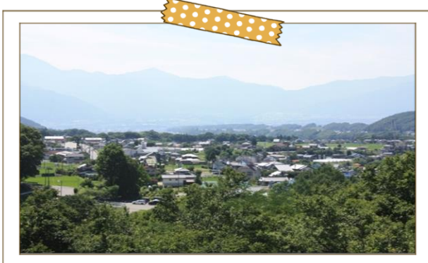
小原区全景 高遠城址から中央アルプスを遠望

高遠町の中心部の南側に位置する河岸段丘状の地区である。また、東に南アルプスと桜の高遠城址、西に中央アルプスと田園風景、南東に五郎山が望める風光明媚な地域である。古くからの小原地区の住戸は70余りで大多数は他地区からの転入で地区自体が若い地域である。地区内には保育園、小学校、高校のほか、スーパー、コンビニ、食堂、菓子店などの商業施設が多くがあり、生活の利便性も高い。