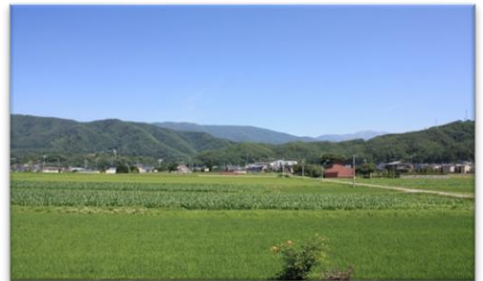
小原区風景 高遠城址、五郎山、南アルプス遠望

地域の行事・事業などに積極的に参加して、地区住民等との交流を深めるとともに、地域の担い手として活躍を期待したい。