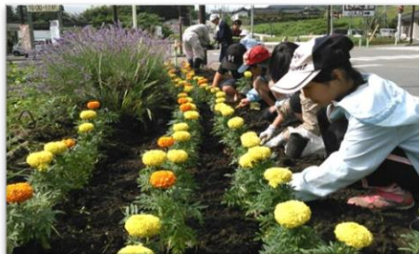
花壇づくり 世代間交流事業として年に5回ほど整備しています。

入区を希望される方は、各総代へご連絡いただき、常会費や常会事の役員の仕事、作業、ごみの出し方についてご確認ください。