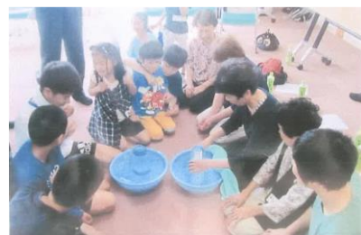
にじいろサロン (三世交代交流会)の様子

いきいきサロン・にじいろサロン 地域の社会福祉協議会が開催する 地域住民の交流活動です。