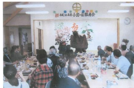
ご長寿を祝う敬老会