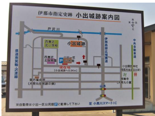
小出一区の小出城跡と文化財

地域の教科書は、地域の様子や行事、必要となる負担など、地域で暮らし始めるために知っておきたい情報を事前にお知らせすることを目的に作成しました。