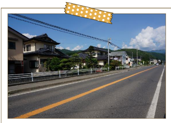
横町区の国道沿い

国道361号線に面した地区で、伊那市街地・高遠方面へのアクセスが良く、スーパーやコンビニ、ホームセンターも車で5分ほどの場所にあり住みやすい地域です。