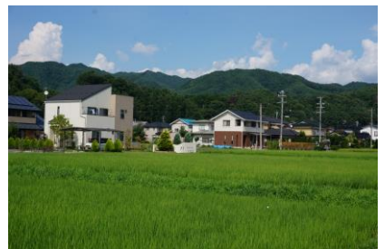
横町区の田園風景

ごみ出しのルールを守りましょう。ごみの出し方は衛生部長または班長にご確認ください。