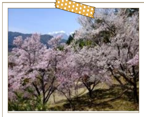
みすず公園の見事な桜

美篤地区の東端に位置し、区内にある子安神社は歴史も古く、伊那市内でも有数の子安神社です。また、隣接する「みすず公園」は隠れた桜の名所で地区住民による整備により、春には美しい花を咲かせ来訪者をお迎えします。