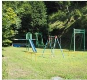
みすず公園には遊具が設置しており子どもたちがのびのび遊べます。

区民の皆が家族のようでやさしい区です。 区内に桜公園があるほか、高遠の桜を見に歩いて行けるようなロケーションも最高です。