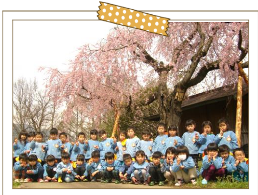
老松場の丘・古墳公園 桜の下で

昔より上殿島（かみとのじま）と言われるこの地区は、城址公園や神社、お寺などが隣接する歴史のある地域です。区内には保育園、小学校があり、中学校も徒歩10分程度の場所にあるため、子育てをするのには大変良い地域です。