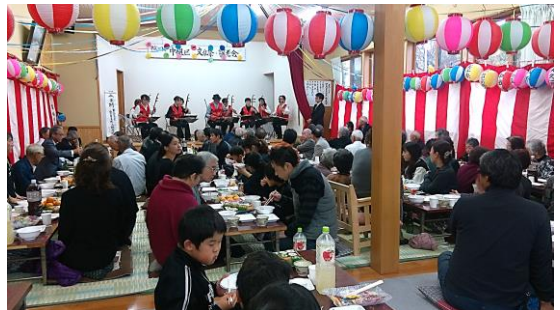
中組区文化祭・敬老会の様子

ごみの出し方や、入区に関すること。地域に関する心配ごとは、区長か組長にお尋ねください。