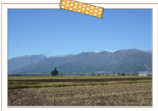
中央アルプスの眺望

平坦で自然災害の心配がほとんどない地域です。また、若い世代が多く住んでおり、小学生数も東春近では一番多く、子育てもしやすい地域です。