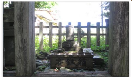
平家の子孫と伝えられている小松氏先祖の墓