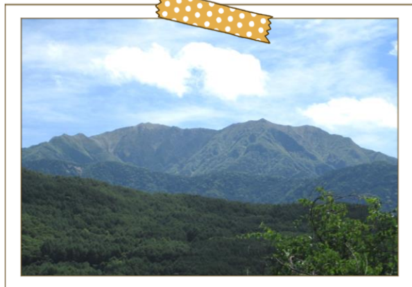
浦より望む仙丈ヶ岳

昔、壇之浦の戦いに敗れた平家の隠れ里として発展したといわれ、今も彼岸の中日には、その子孫と言い伝えられる小松氏先祖の墓前に赤旗を持って集まり、供養を行っています。東方には南アルプス仙丈ヶ岳の雄姿がそびえ、夕日に染まる仙丈ヶ岳は一見の価値があります。