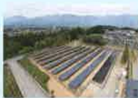
リユース品を使用した発電所