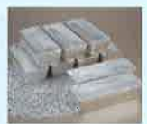
有用金属(銀)のイメージ