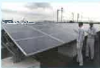
太陽光発電設備の検査の様子

使用済みとなった太陽光 パネルには、再販売可能な ものもあり、既に多くのリ ユース事例が報告されて います。