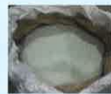
破碎・選別したガラス