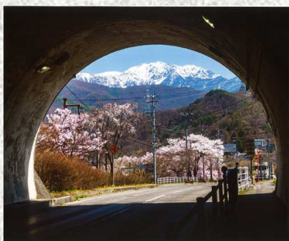
↑佳作 「トンネルの向こう は絶景でした」 ・布施さやか（松本市） ・白山トンネル→南アルプス