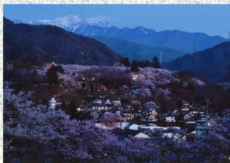
↑佳作 「春の宵」 ・丹羽 明仁（愛知県） ・高遠城址公園