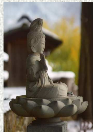
↑佳作 「雪晴れ」 ・大学 肇（松本市） ・建福寺